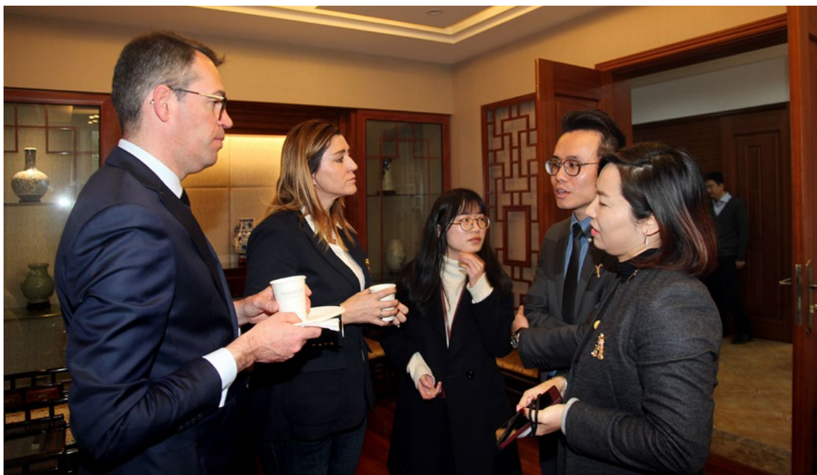
会后中法双方交流

上述规则有一个例外，如果死者与某个国家有密切联系，且密切程度明显超过生前最后的经常居住国，这时候可以破例适用该国的法律：比如，一位法国侨民，通常与家人住在法国，他的全部财产也在法国境内。他受雇主派遣去瑞士的子公司工作，为期半年，在完成使命即将回国的前几天，不幸在伯尔尼去世。负责办理继承的法国公证人可以认为此案应当适用法国法处理继承事宜，因为法国法律与死者的关系，显然比瑞士法律更为密切。