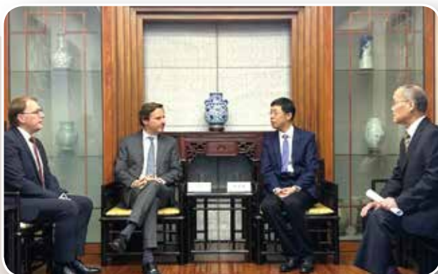
▲ 11月27日上午，上海市司法局党委书记、局长吴坚勇在上海中法公证法律交流培训中心会见来沪访问的法国公证人高等理事会主席萨伏瑞一行，并展开座谈交流。