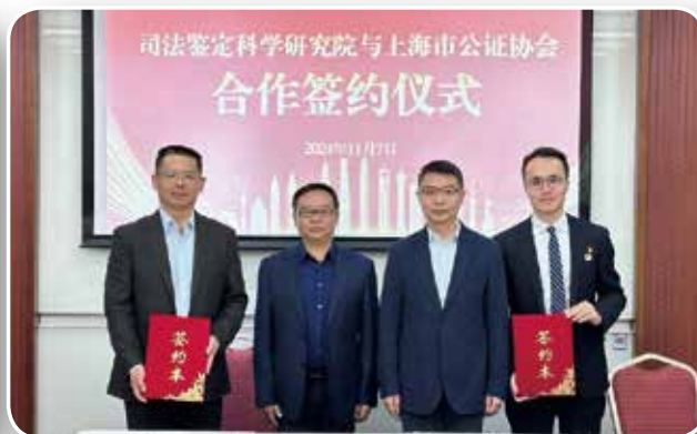
▲ 11月7日，上海市公证协会与司法鉴定科学研究院共同签署合作协议，携手共创公共法律服务新模式。上海市司法局党委委员、副局长董海峰，司法鉴定科学研究院党委副书记、院长舒国华参加签约仪式。