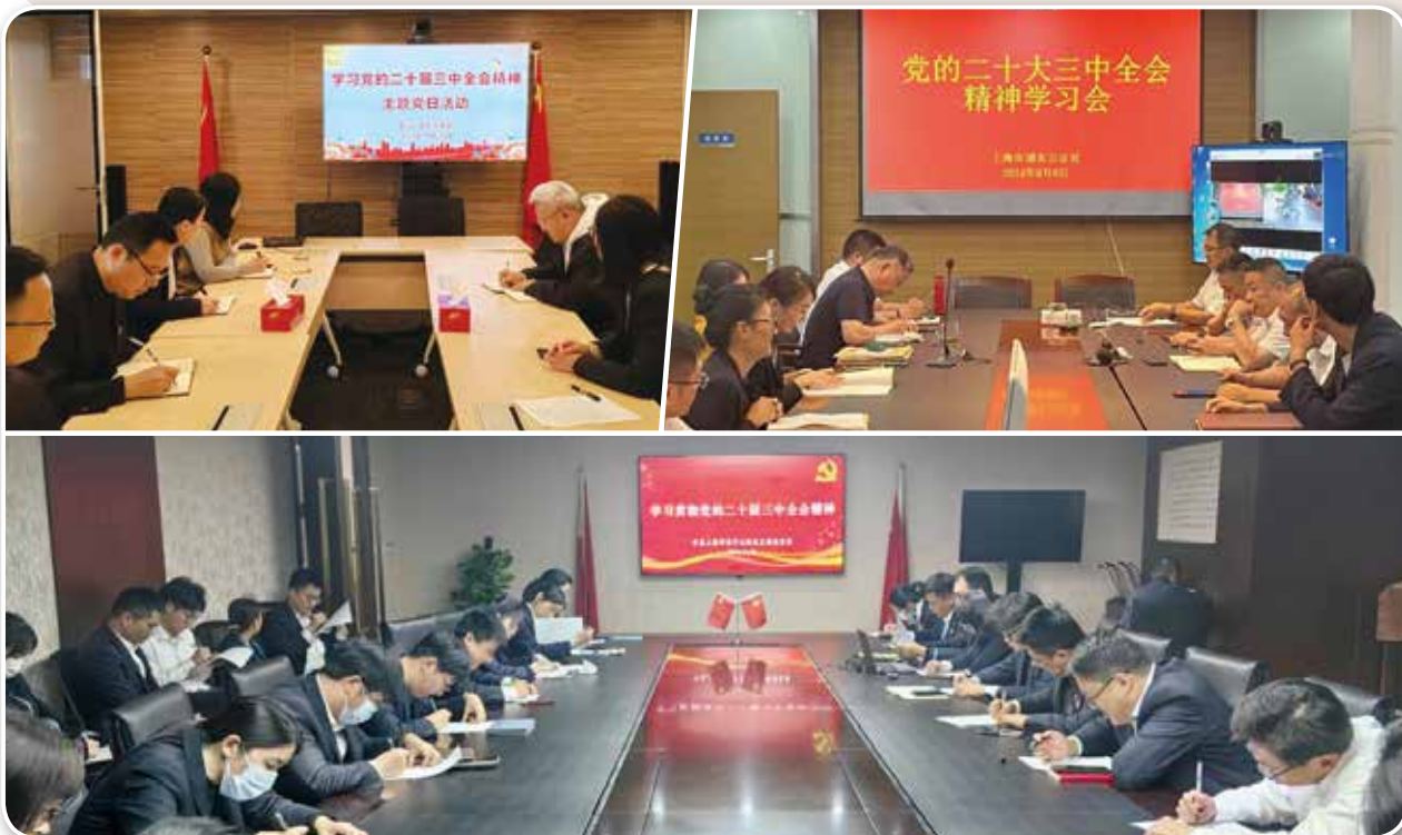
▲ 上海公证行业认真学习贯彻落实党的二十届三中全会精神