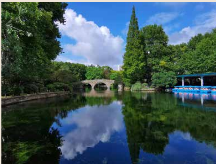
《一池春水》（黄浦公证处 方旭华）