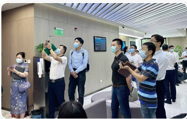
▼ 2022年9月21日，徐汇公证处开展“云上线下齐联动 利企便民再升级”公证开放日活动。