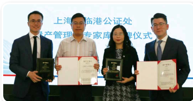
▲ 2022年9月21日，临港公证处与上海德禾翰通律师事务所举行合作签约仪式暨遗产管理人推荐库授牌仪式。