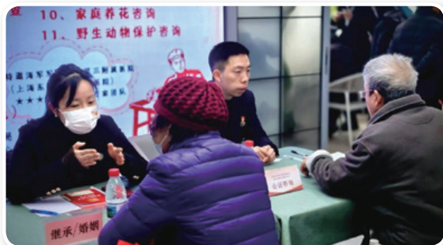
杨浦公证处参与杨浦公园党群服务站“志愿春风拂杨浦，雷锋精神耀公园”学雷锋活动。