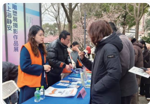
东方公证处参加石门二路街道“星火汇聚 温暖石二”学雷锋日主题活动。