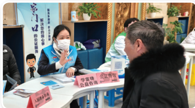
闵行公证处赴吴泾镇、莘庄工业区开展公证公益咨询、普法宣传活动。