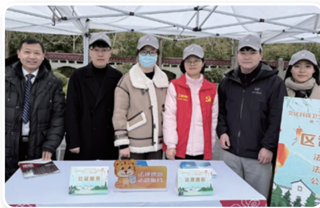
松江公证处赴泖港镇社区文化中心参加送法“三下乡”暨“3.5”学雷锋主题活动。