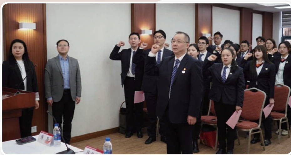
2024年12月31日，上海市公证协会举行2024年度新任公证员宣誓仪式。