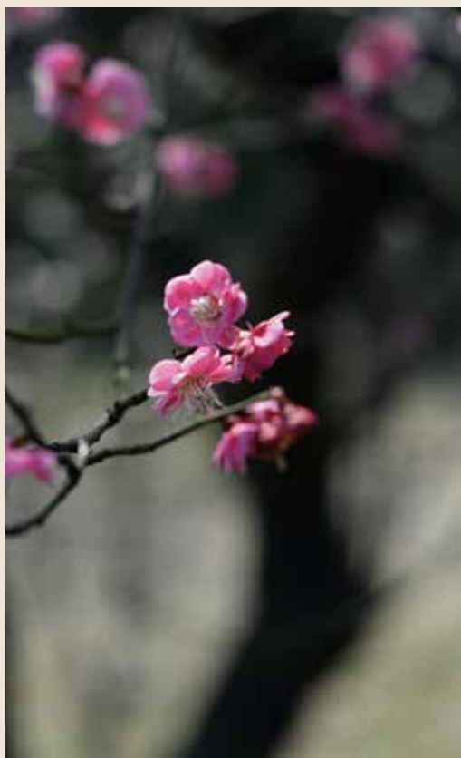
《一枝寒梅独自开》（方旭华）