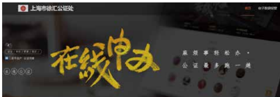
上海市徐汇公证处在线公证平台

制定推行《关于改进遗嘱公证办理的十项措施》《关于推行遗嘱咨询预约接待值班制的规定》，从根本上解决遗嘱公证的诸多现实难题；完善在线办证平