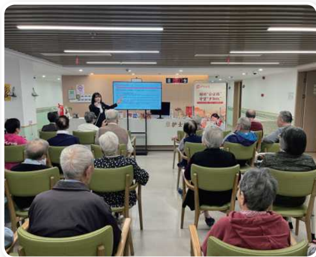
▲ 10月21日，卢湾公证处走进慧享福·福荟养老院，开设遗嘱公证法律知识专题讲座。