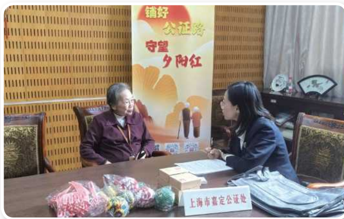
10月22日，嘉定公证处走进颐康养老院，开展公益公证法律服务活动。 ▶