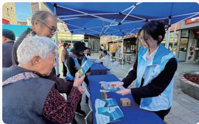
▲ 10月29日，青浦公证处参与“孝亲敬老，上善青浦”敬老月大型咨询服务活动。