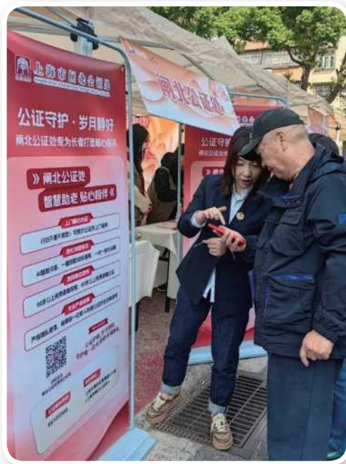
▲ 10月28日，闸北公证处参与彭浦新村街道举办的“情暖彭浦 爱在重阳”便民服务活动。