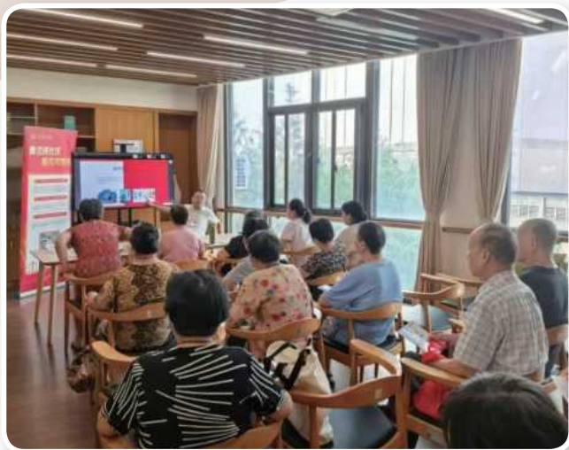
▲ 10月15日，市北公证处前往为老服务中心开展普法讲座。