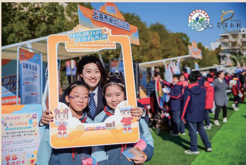
《宪法宣传日》（薛仲伦）