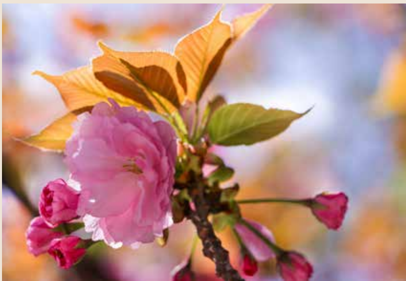
红紫芳菲：始·盛（作者：杨健美）