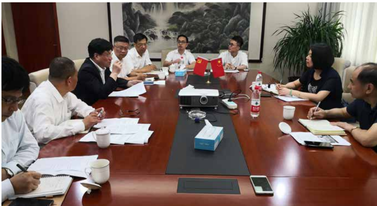
8月7日,上海市公证协会党委召开“不忘初心,牢记使命”主题教育调研成果交流会

上海市公证协会党委在市委、市司法局党委的领导和主题教育第二督导组的指导下,认真贯彻落实主题教育“守初心、担使命、找差距、抓落实”总要求,密切联系实际,精心周密部署,不断统筹推进,主题教育开展氛围浓厚,取得了良好效果。