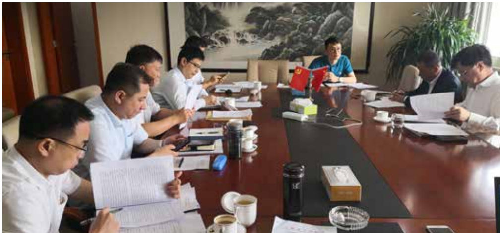
7月8日， 上海市公证协会党委 组织中心组集中学习

习近平总书记考察上海重要讲话精神以及历年来关于上海工作的重要指示批示精神等。围绕重点学习内容，协会党委制订了集中学习专题计划，围绕“‘不忘初心，牢记使命’，坚定理想信念”、“中国共产党的奋斗历程”、“强化组织性，严肃纪律性”、“新时代党性修养如何锤炼”、“坚持党的领导、争当改革先锋”主题开展了5次党委中心组集中学习，并在集中学习中开展了先进典型教育和警示教育。党委副书记杨昌麟在协会为各党委委员上党课，各党委委员分别在各公证处上党课。